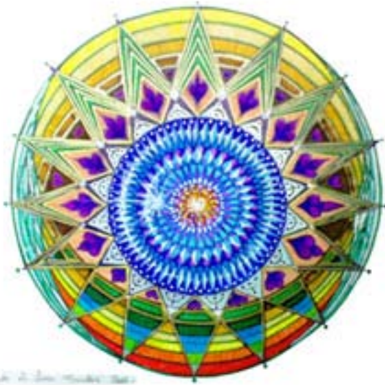
Prayer Mandala by Sri Sri Prabhakar Das